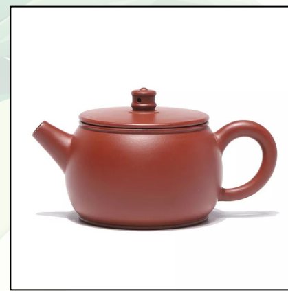
Исинский Чайник” Сы Тин” 130 мл 26 000 тг