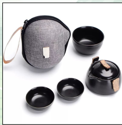
Офисный набор: гайвань, 3 пиалы 9 000 тг