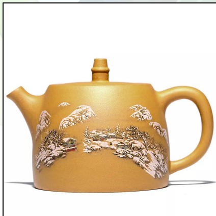
Исинский Чайник Хань До 480 мл 34 000 тг