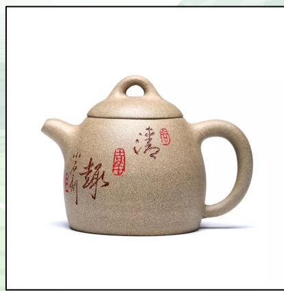
Исинский Чайник "Циньская Гиря" 240 мл 26 000 тг