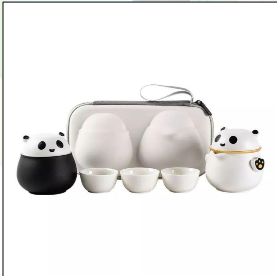
Сервиз: Чайная Панда 14 500 тг