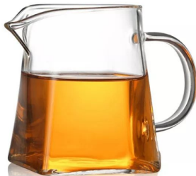
Чай стекло 300мл 5 500 тг