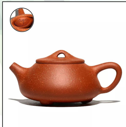
Исинский Чайник “Ши Пяо №15” 220 мл 22 000 тг