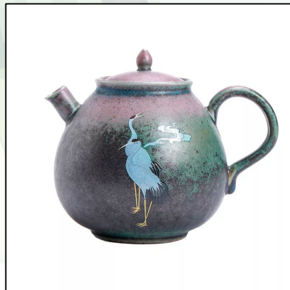
Керамический чайник Шуй Ди Ху, Журавли, 260 мл. 22 000 тг