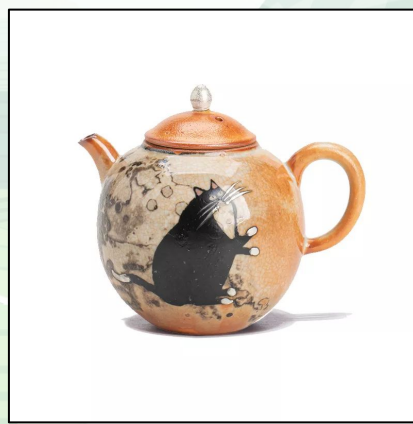
Чайник "Озорной Котик", Дэ Хуа, 120 мл. 19 000 тг