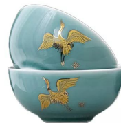
Пиала селадоновая 50мл 1 800 тг/шт