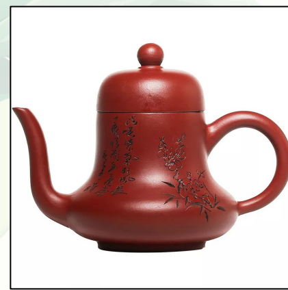
Исинский Чайник "Сы Тин" 130 мл 26 000 тг