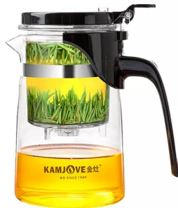
Типот Гунфу ча 500 мл 9 000 тг