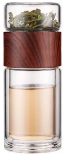
Колба - бутылка для заваривания 300 мл 5 000 тг