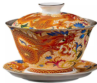
Гайвань "Сян Лун" 180мл 6 500 тг