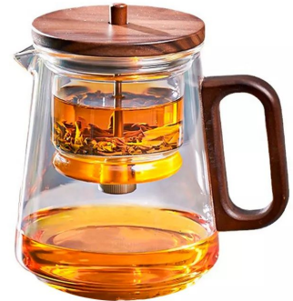
Типот Gongfu Premium, 800 мл 20 000 тг