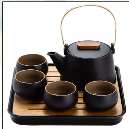
Японский чайный сервиз 22 000 тг