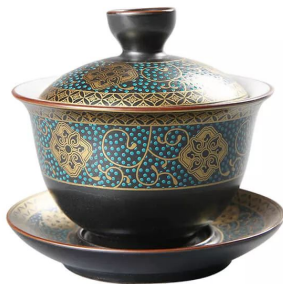
Гайвань фарфор "Гу Юнь" 150мл 9 000 тг