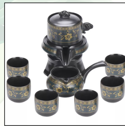
Чайный сервиз: черная керамика 24 000 тг