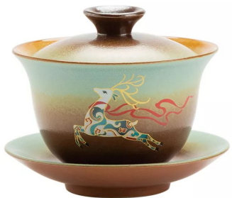
Гайвань "Путь чая" 180мл 9 000 тг