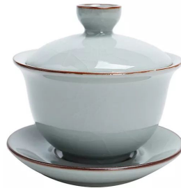
Гайвань Гуань Яо 150мл 13 000 тг