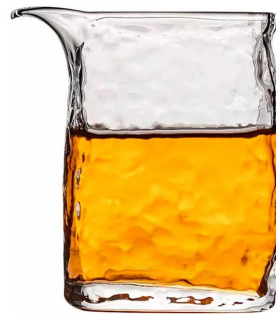
Чай стекло Айсберг 200мл 6 600 тг