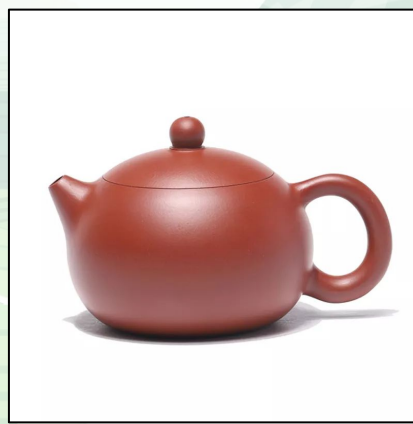
Исинский Чайник “Си Ши №16” 240 мл 21 000 тг