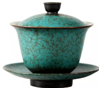
Гайвань глиняная 150мл 9 500 тг