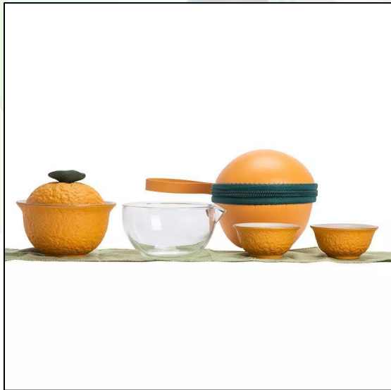
Дорожный набор: Апельсин