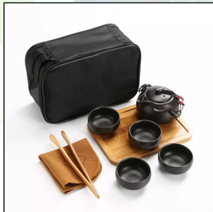
Чайный комплект: гайвань и четыре пиалы 9 000 тг