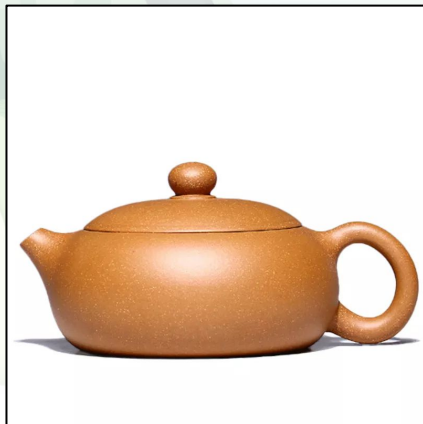
Исинский Чайник "Бянь Си Ши" 220 мл 27 000 тг