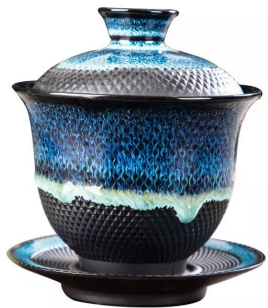
Гайвань керамическая 200мл 7 000 тг