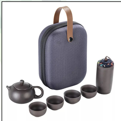
Малый набор путешественника 9 500 тг