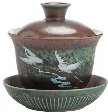
Гайвань "Журавли" 300мл 16 000 тг