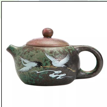
Керамический чайник Си Ши Фу Гу, Журавли, 220 мл. 12 000 тг