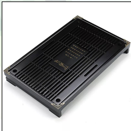
Чабань чёрная Ли Бо 43x27 см 23 000 тг