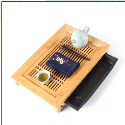
Чабань бамбук 40x29 см 24 000 тг