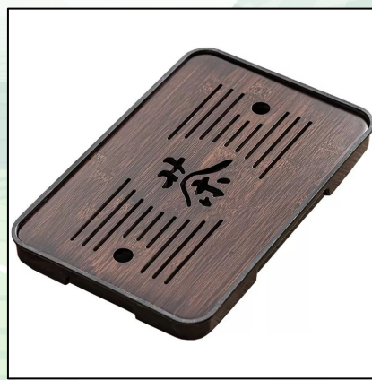
Чабань бамбук черная 32x19 см 12 000 тг