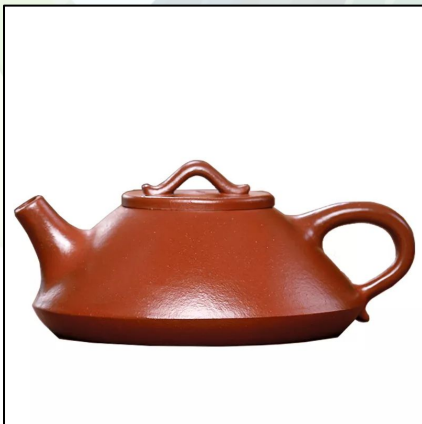
Исинский Чайник Шы Пяо 180 мл 23 000 тг