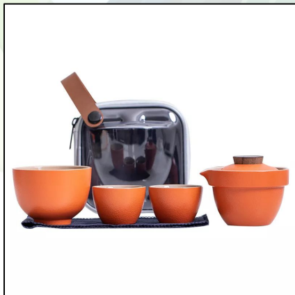
Набор: Гайвань и 3 пиалы 9 000 тг