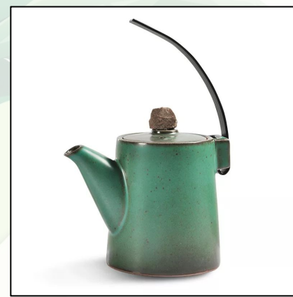
Дизайнерский чайник с дужкой 16 500 тг