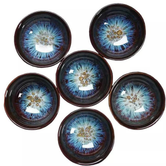
Дизайнерская пиала 60мл 1 900 тг/шт