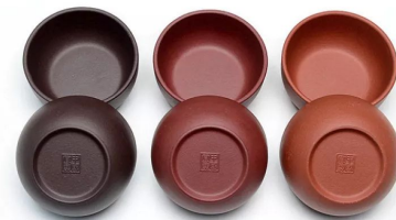
Пиала из исинской глины 35мл 1000 тг/шт