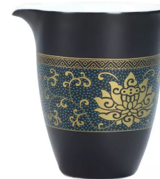
Чай керамическая 200мл 6 000 тг