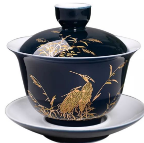
Гайвань селадоновая "Лазурная" 150мл 8 000 тг