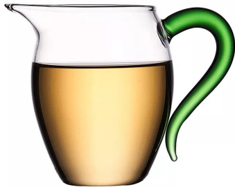
Чай стекло 350мл 5 500 тг