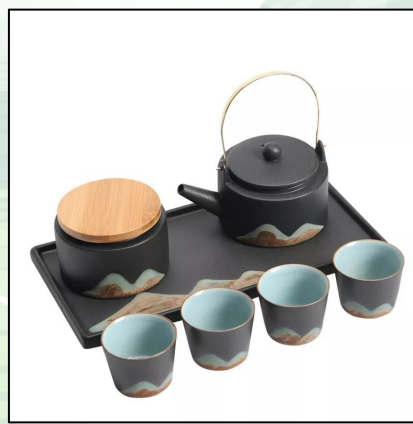
Чайный сервиз: у подножья гор 28 000 тг