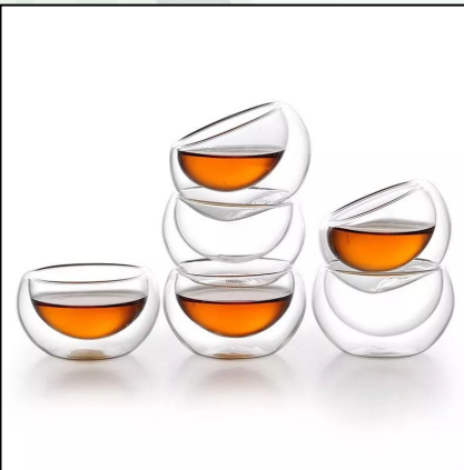
Пиала с двойным стеклом 50мл 1200 тг/шт