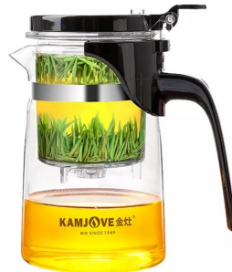
Чайник стеклянный 200 мл 6 500 тг